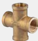
Кръстач - Месинг - Rp-резба Модел 1632